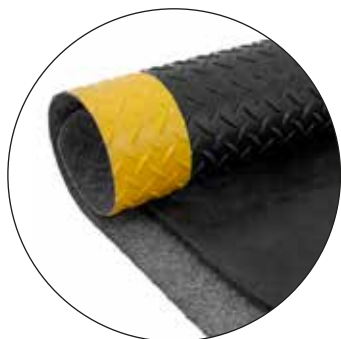
BASE DE ESPONJA DE PVC