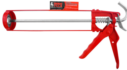
TIPO ESQUELETO CLAVE: SP2038