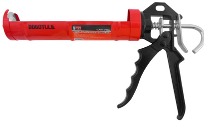
TIPO REFORZADA CLAVE: SP2080