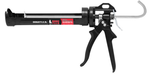
TIPO REFORZADA PRO INDUSTRIAL CLAVE: SP2090