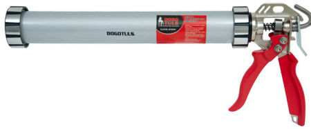
TIPO SALCHICHA PRO INDUSTRIAL CLAVE: SP2091