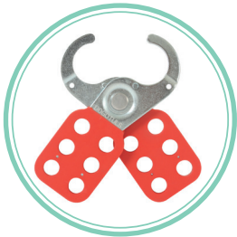
APERTURA DE QUIJADAS DE 1" (25mm)