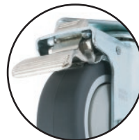
ZF5092 - ZF5093