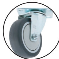
ZF5089 - ZF5090