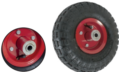
Rueda neumática 260mm