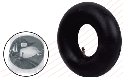
Cámara para rueda neumática de 260mm