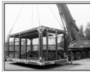
MOVER O LEVANTAR CARGA