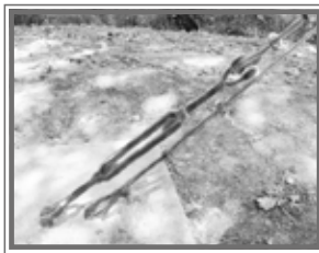
TENSAR CABLES DE ACERO