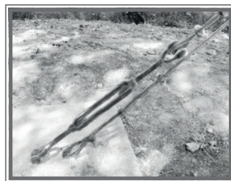
TENSAR CABLES DE ACERO