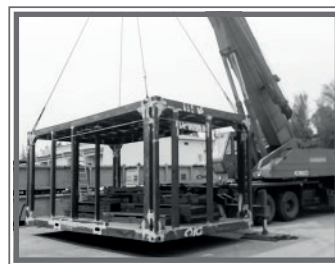
MOVER O LEVANTAR CARGA