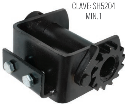
CLAVE: SH5204 MIN. 1