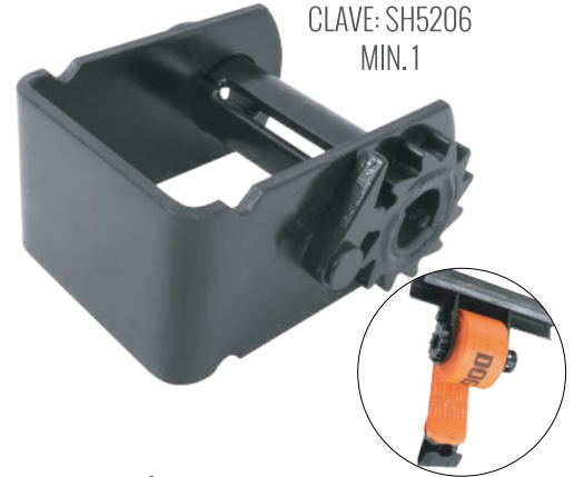
CLAVE: SH5206 MIN. 1