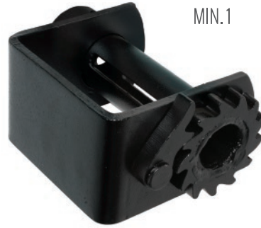
CLAVE: SH5205 MIN. 1