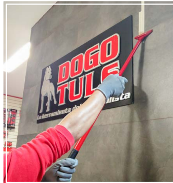
IDEAL PARA PISOS O DISTANCIAS CORTAS