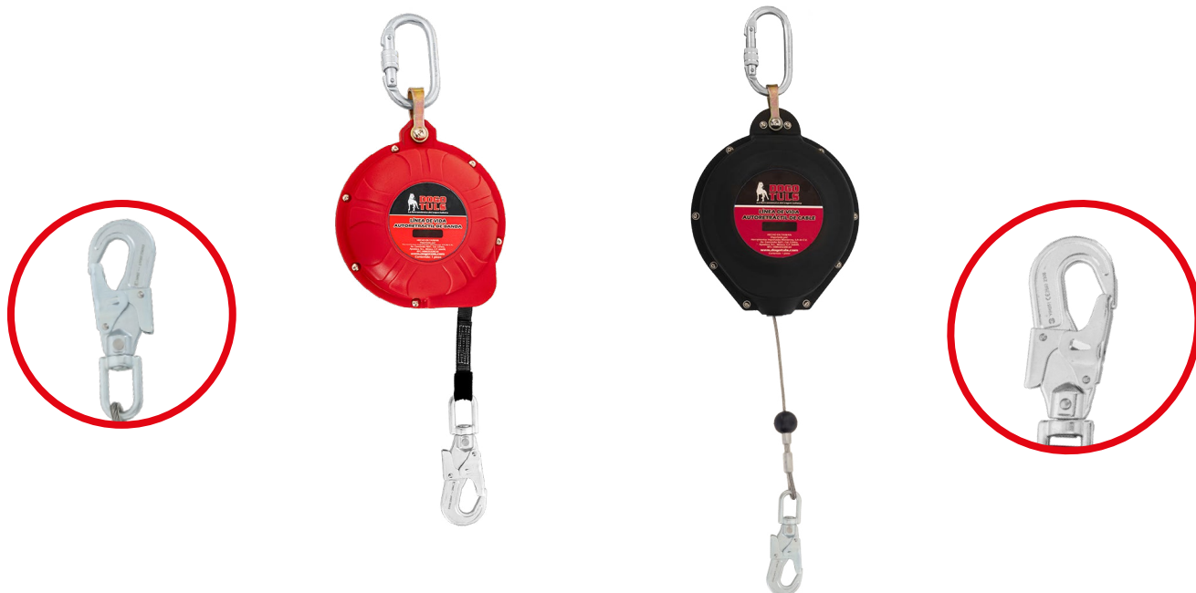
TIPO CABLE DE ACERO