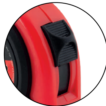
BOTÓN DE FRENO