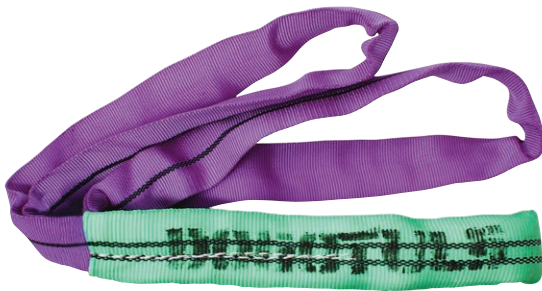
CLAVES: HK5138 HK5139