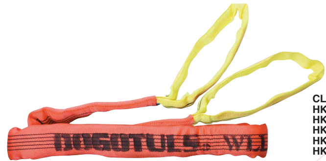
CLAVES: HK5141 HK5142 HK5143 HK5144 HK5145