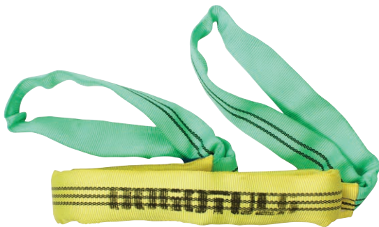
CLAVES: HK5100 HK5141