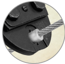
Funciona para casquillos de 3/8"