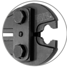
Mordaza de CrV (cromo vanadio)