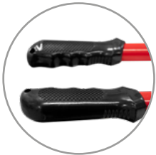
Mangos ergonómicos con recubrimiento