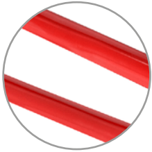
Cuerpo de acero forjado